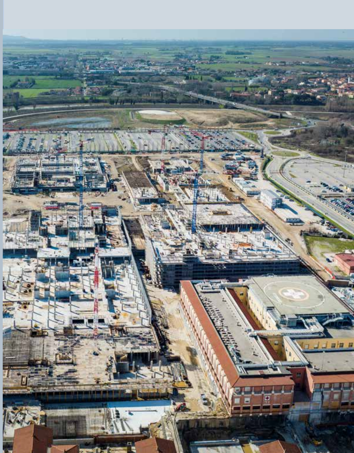
POLO OSPEDALIERO UNIVERSITARIO "NUOVO SANTA CHIARA" A CISANELLO - PISA

Ferroberica tiene costantemente monitorato il grado di soddisfazione del cliente. I risultati delle valutazioni vengono utilizzati sia per il miglioramento in ambito di produzione, sia in tutte le fasi che concorrono alla costruzione di un customer service "eccellente".